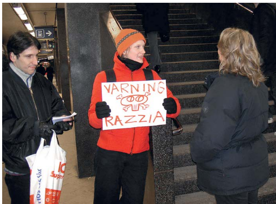
Varning för biljettrazzia på Slussen 2004

vägen: 80 kronor skulle det kosta för politikerna att ta sig till jobbet, precis som de absurda priserna på enkelresor i kollektivtrafiken som de själva just infört. Aktionen funkade bra eftersom det inte fanns något bra val för politikerna: antingen betalade de, och gav pengar till Planka.nu:s kamp samt godkände att vem som helst kan införa spärrar och avgifter i stan, eller så plankade de helt enkelt förbi blockaden - precis på samma sätt som vi reagerade på deras höjningar av avgiftstrycket. De flesta valde att planka.