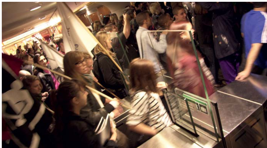
Massplankning på T-centralen 2011

ordningsproblem i samband med massplankningen medför alltså att en mängd andra människor kan passera spärrarna utan att riskera att klämma sig. En massplankning innebär alltså att vi tillsammans faktiskt kan införa nolltaxa för ett par timmar – bara genom att gå ihop och agera. Den sortens makt får vi inte av att tycka till i media eller debattera. Samtidigt blir det som tidigare bara var en station - förknippad med långtråkig pendling – en plats där vi gör motstånd. Den känslan, som tyvärr är alltför frånvarande i vår vardag, att vi har makten att påverka och genomföra en förändring här och nu ska verkligen inte underskattas.