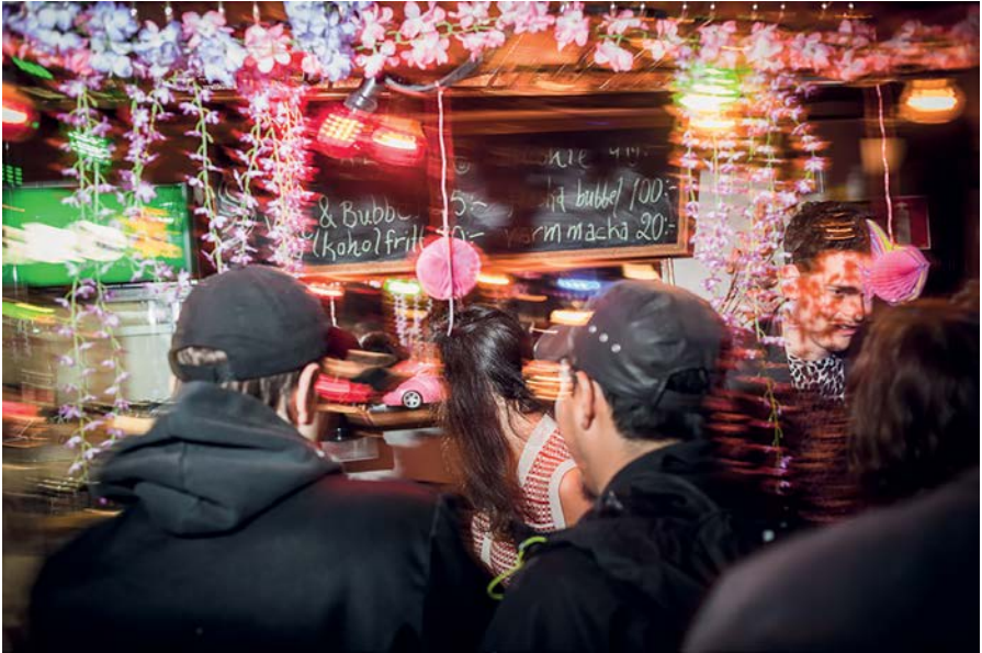
Fest tillsammans med Linje 19 (2012)

På ingen av festerna spelades den mest kända plankalåten, nämligen Svensk Pops "Hon bor i Farsta" från 2004. Däremot tryckte vi upp en massa (antagligen för många) CD-singlar tillsammans med bandet - som gjorde en T-baneturné!