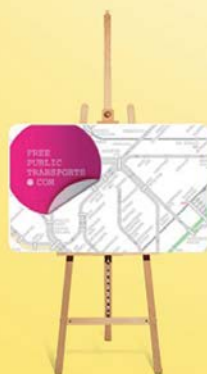
FREE PUBLIC TRANSPORTS