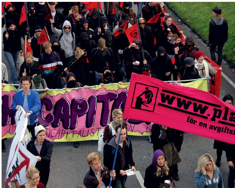
Demonstration under European Social Forum i Malmö 2008

TIPS Studera en helt vanlig dag i ditt liv – vad gör du och vad finns det för konflikter att organisera sig kring? Det kan handla om jobb, fritid, resor eller något helt annat. Men kopplingen till vardagen ger frågan extra tyngd. En annan fördel med att hitta ett ämne nära dig själv är att det är du som är experten!